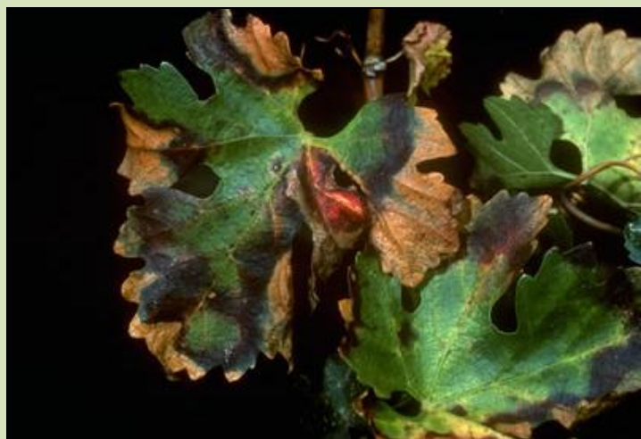
Doença de Pierce na videira

Não existem meios diretos de luta contra as doenças causadas por Xylella fastidiosa . A proteção passa por medidas preventivas , impedindo a sua introdução e propagação ► em novas plantações, utilizar plantas sãs provenientes de viveiros autorizados pelos Serviços Oficiais; ► arrancar e queimar as plantas atacadas e ► combater os insetos vetores.