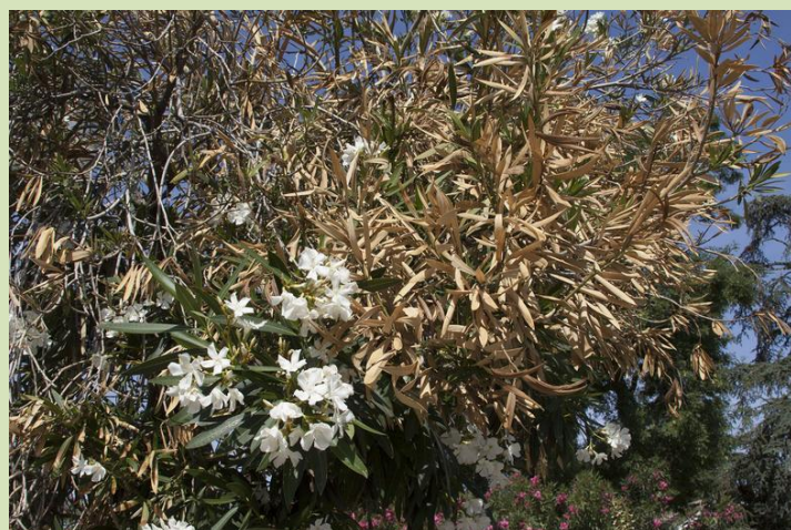
Declínio de ornamentais (aloandro)