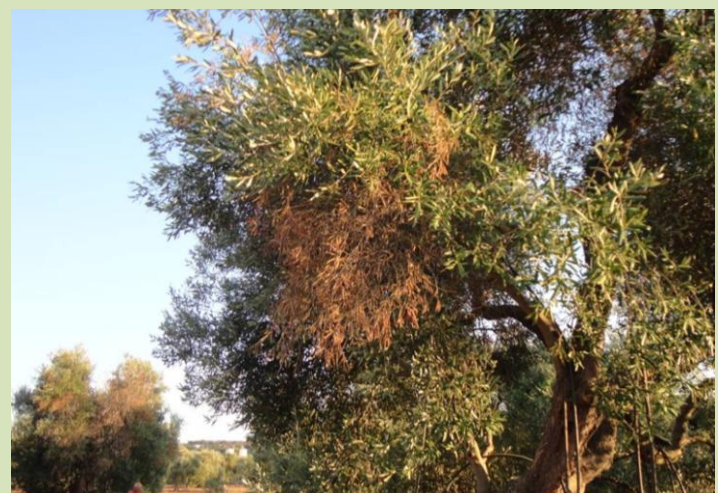
Declínio rápido da oliveira