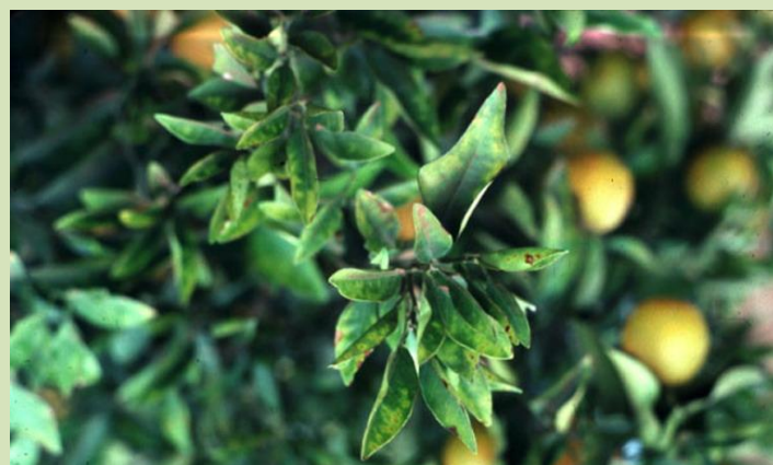
Clorose variegada dos citrinos