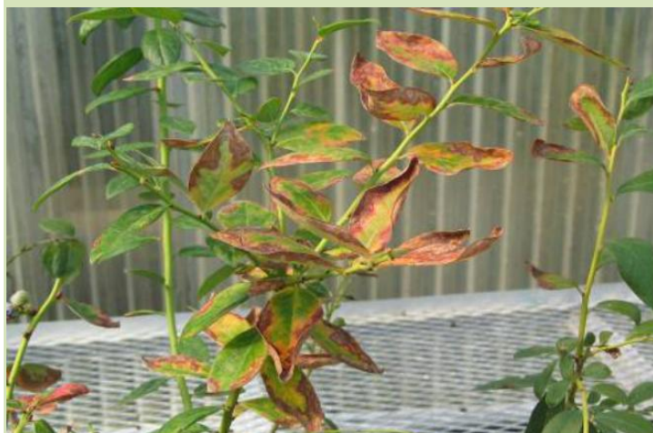
Declínio da planta de mirtilo