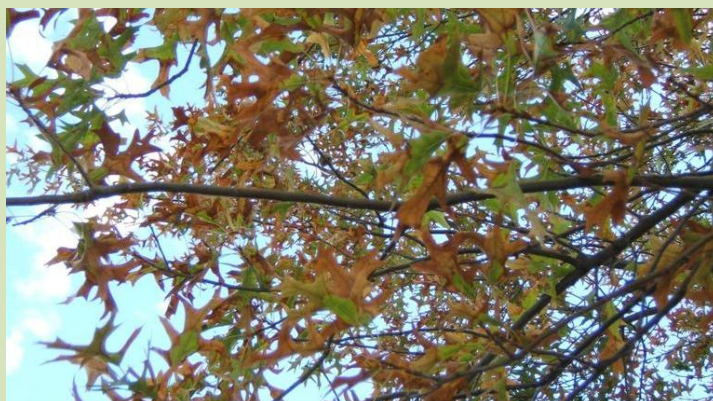
Declínio de essências florestais (carvalho americano)

Nesta fase, para evitar a entrada da doença no país , importa ter os maiores cuidados com a proveniência de material para novas plantações.